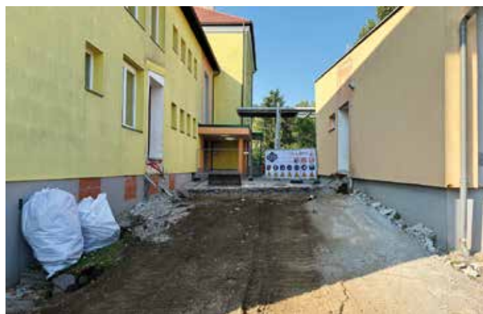
Volksschule Ebenthal: Schulumbau hat begonnen

Als erste Maßnahme wird der derzeitige Verbindungstrakt zwischen Volksschule und Turnsaal abgebrochen. Im Laufe der heurigen Sommerferien wird der Zubau errichtet, das Stiegenhaus erneuert und der Lift eingebaut. Weiters werden die sanitären Anlagen komplett erneuert. Die Arbeiten werden sehr zügig vorangetrieben. Zu Schulbeginn im Herbst 2026 werden die angeführten Maßnahmen dann abgeschlossen sein. Im Laufe des heurigen Herbstes werden dann die Innenarbeiten beim Zubau, der einen Speisesaal für die Schule, einen solchen für den Kindergarten sowie einen Bewegungsraum und Nebenräume für den Kindergarten beinhaltet.