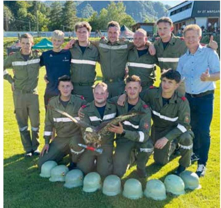
FF Mieger – Gruppe 8