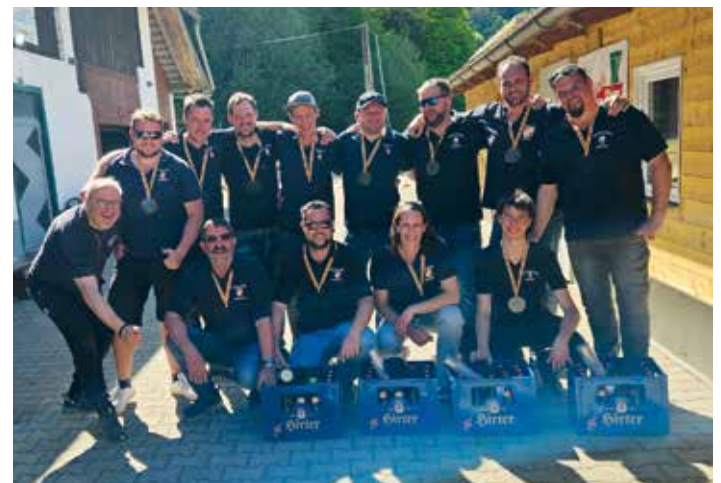
2x FF Mieger vor FF Ebenthal am Stockerl

Bei schönstem Wetter traten 64 Teilnehmer:innen in 16 Moarschaften aus allen vier Freiwilligen Feuerwehren der Marktgemeinde , der Bergrettung Klagenfurt-Ebenthal und der Polizeiinspektion Ebenthal in entspannter Atmosphäre gegeneinander an und lieferten sich teils spannende und packende Duelle. Gleichzeitig bot das Turnier ein einzigartiges Erlebnis und eine erstklassige Unterhaltung. Trotz aller sportlichen Ambitionen kam der Spaß keineswegs zu kurz – vordergründig waren überhaupt das Vernetzen, gemeinsames Lachen und freundschaftliche Gespräche.