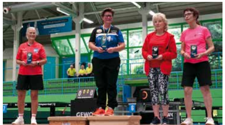
Siegerehrung Damen Einzel Schwebbahn Cup 2026