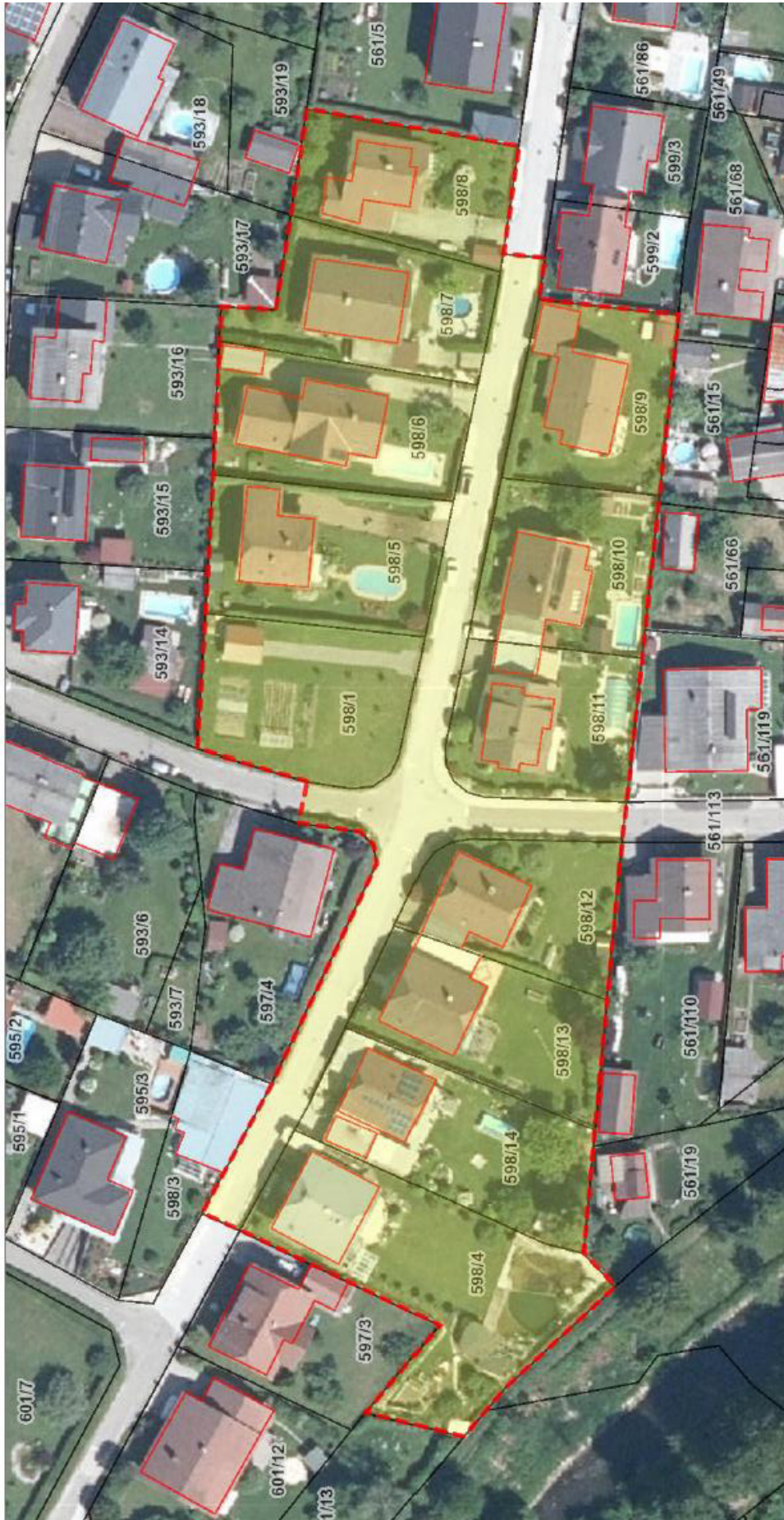
Abbildung 1: Planungsraum